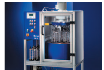
Schleppfinishmaschine DF Drag-finishing machine DF