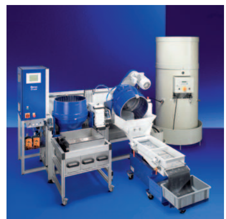
M50 im Betrieb | M50 at work