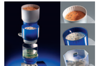
Tellerfliehkraftmaschine ECO-Maxi Disc-finishing machine ECO-Maxi