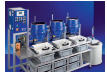
Tellerfliehkraftmaschine CF Disc-finishing machine CF